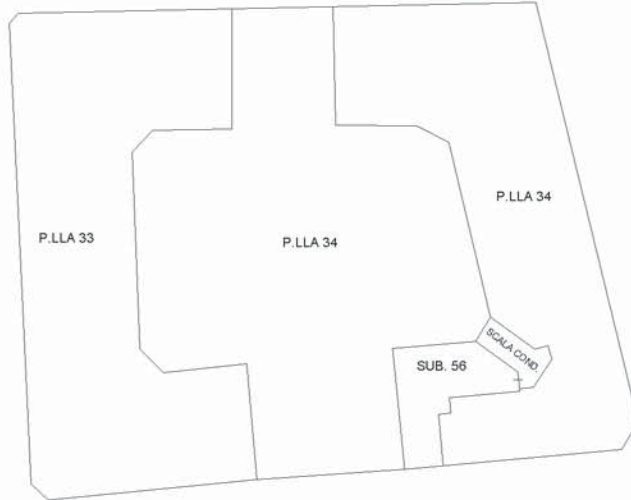
PIANO PRIMO SOTTOSTRADA